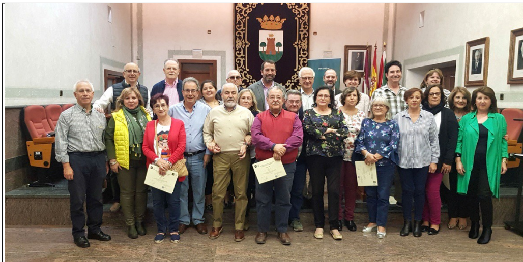
Entrega de diplomas